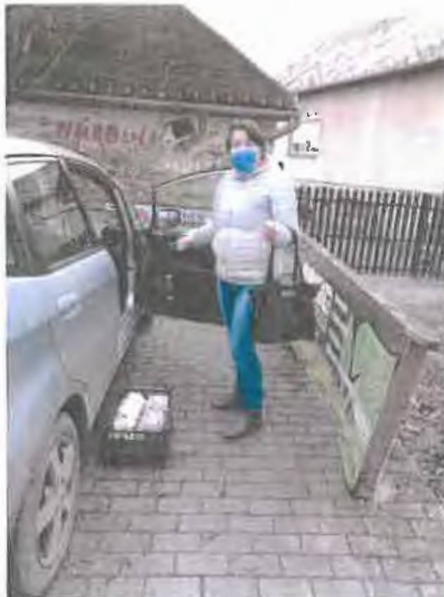
Gulyásleves osztás Velencén