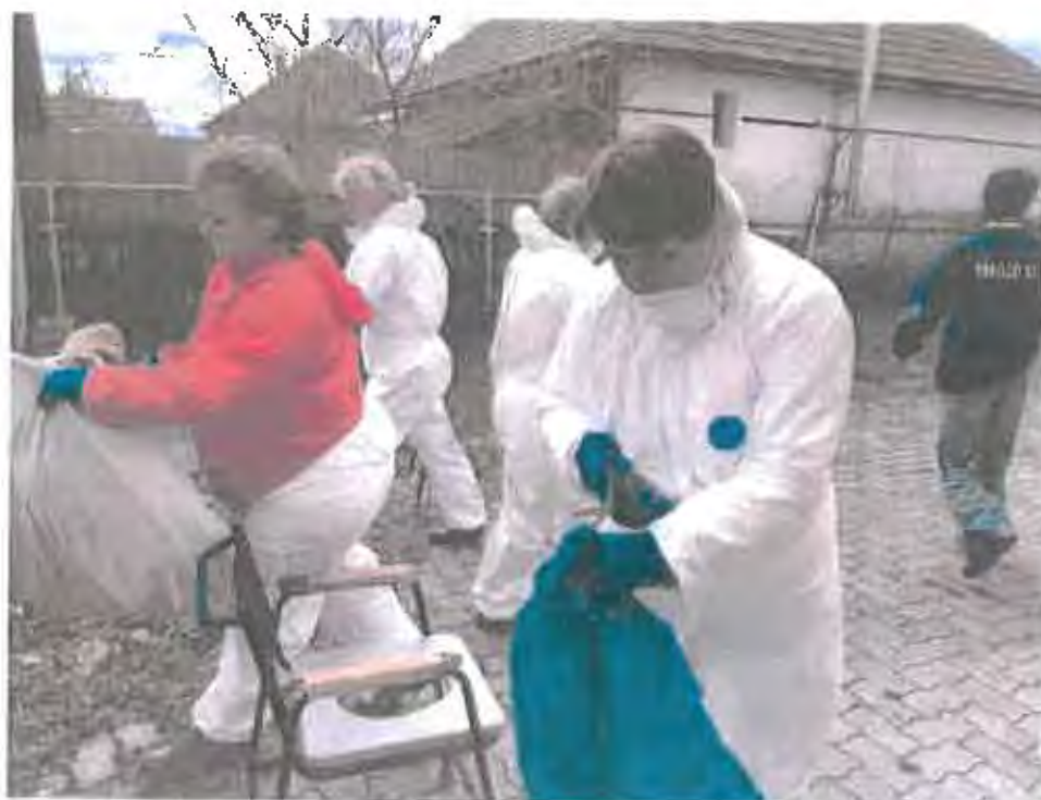
Krizishelyzet elhárítása Pákozdon. (Vírus megjelenése előtt.)