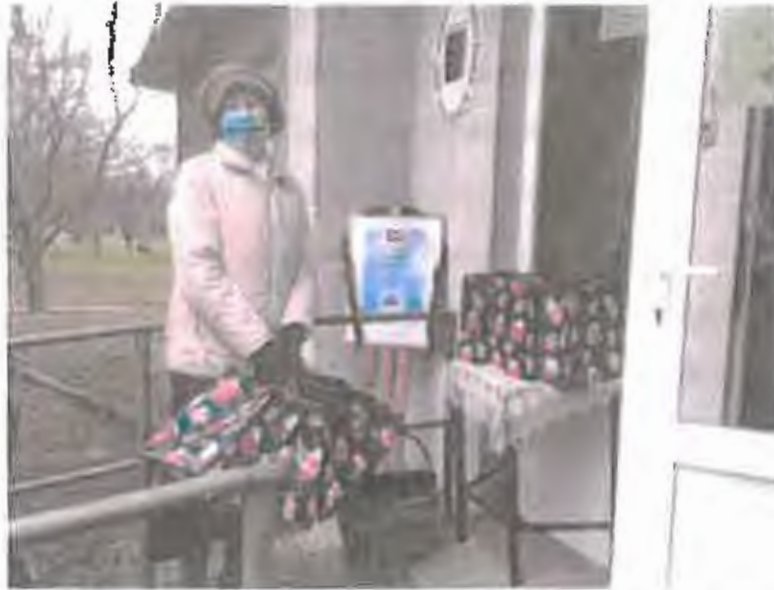
Nyugdíjasok karácsonyi ajándéksomagjainak osztása Velencén.