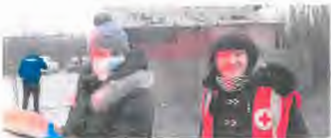
Köszönő levél Velencéről, élelmiszer-csomag osztás Pázmándon.